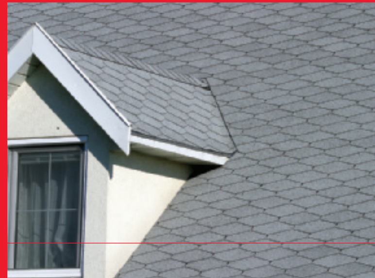
Park Molenheide - Belgium